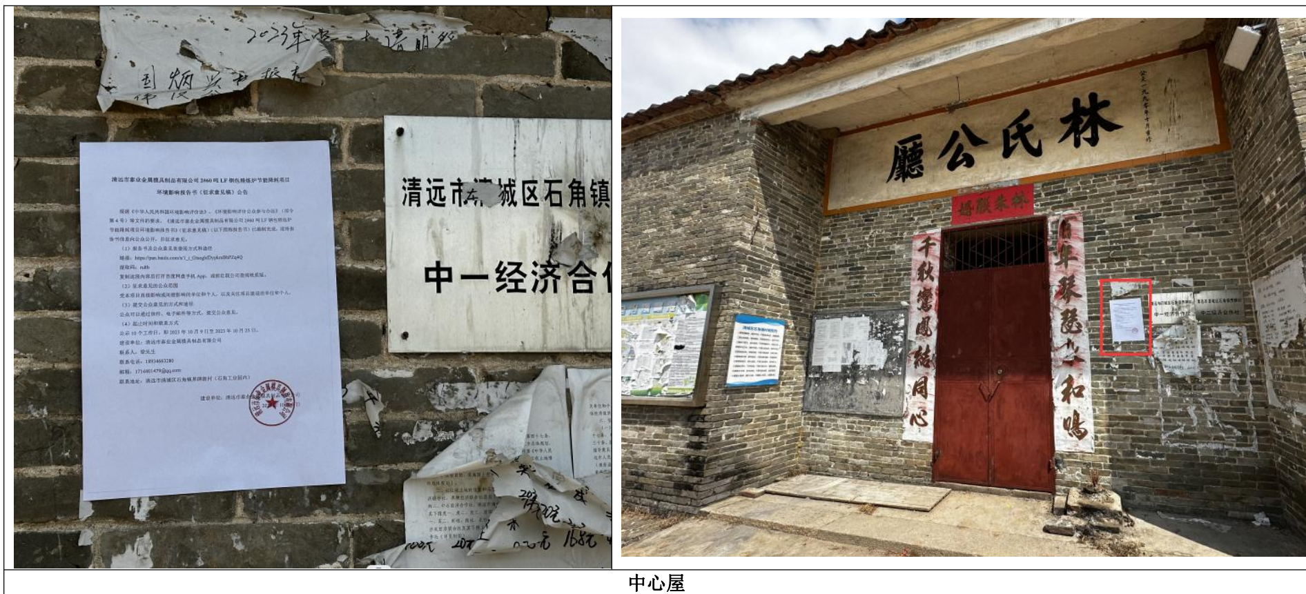
中心屋 图 3.2-4 征求意见稿公示信息张贴图