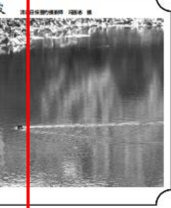
图 3.2-2 征求意见稿公示信息第二次刊登清远日报截图