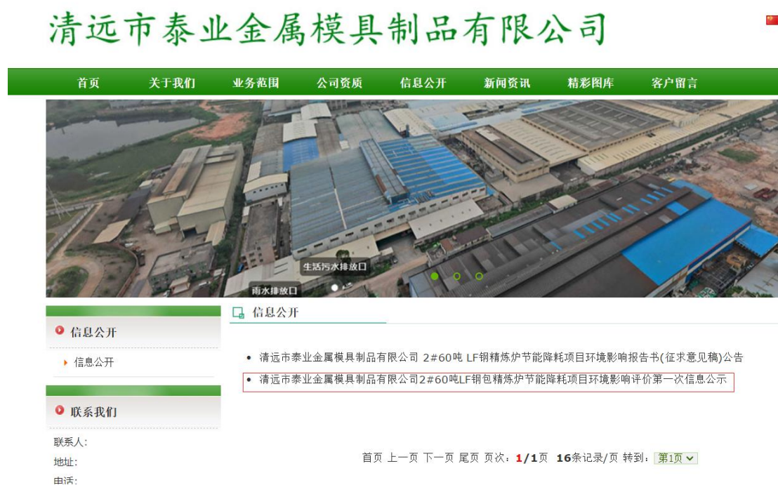
图 2.1-1 (a) 本项目首次环境影响评价信息公示截图 (1)