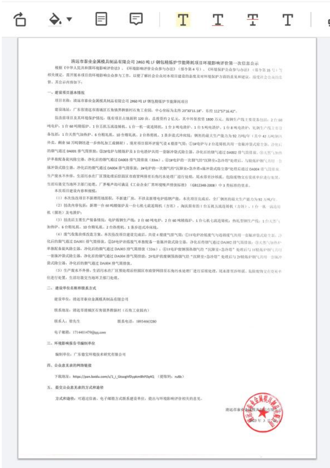
图 2.1-1 (b) 本项目首次环境影响评价信息公示截图 (2)